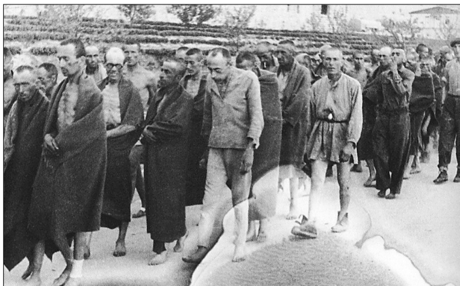
A la izquierda, presos españoles salen de Mauthausen tras la liberación del campo de concentración. En la página anterior, internos españoles trabajando

La infancia y la adolescencia de Eufemio transcurrieron en un colegio. Perdió el contacto con el resto de su familia. Ni él ni su madre, ni su hermana, con la que pudo recuperar la relación y que hoy vive en Baracaldo, cobraron jamás pensión de huérfano. Ahora intentan cobrar las indemnizaciones fijadas por el Gobierno francés para los ciudadanos cuyos padres hubieran muerto en campos de concentración alemanes, que hubiesen sido deportados. Los interesados pueden obtener información en el correo electrónico centro@exilioydeportacion.com.